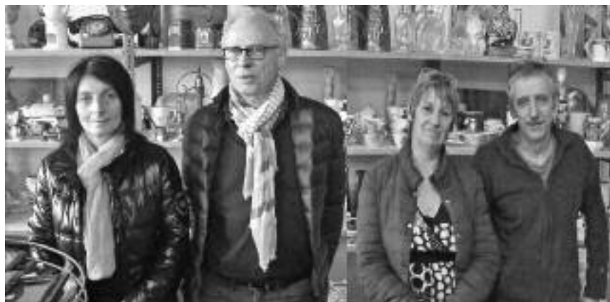
La présidente et une partie des membres de l'association Nouvel'R