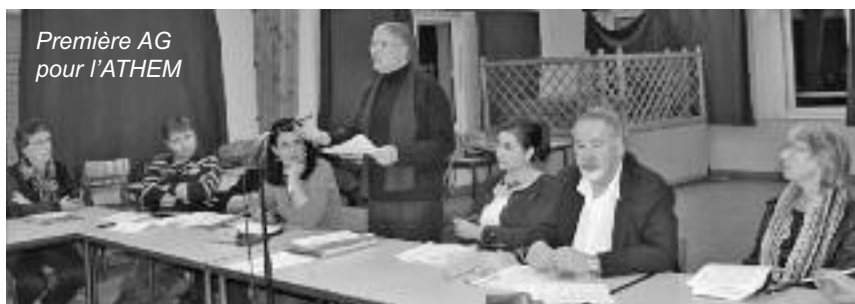
Première AG pour l'ATEHM