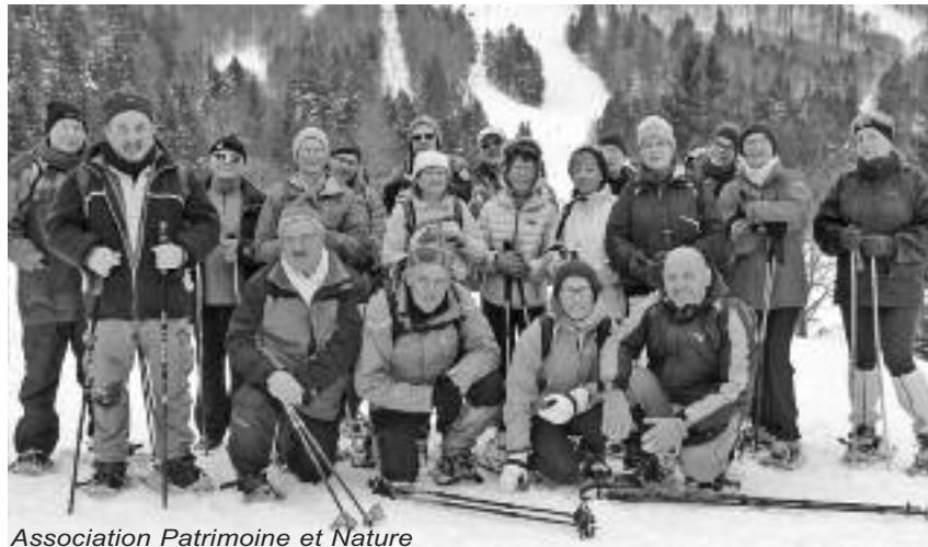
Association Patrimoine et Nature

Les Gais Lurons de Bertrimoutier organisent, à la salle polyvalente, un repas dansant le dimanche 13 mars dès 12h avec l'orchestre