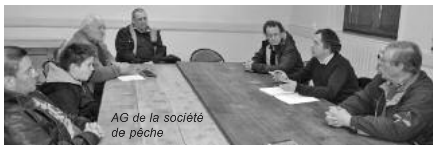
AG de la société de pêche

- Mercredi 16 mars à 18h au relais de la cité, salle du rez-de-chaussée pour les rues suivantes :