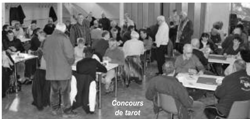
Concours de tarot

heureux de voir perdurer ce type d'animation à Ban de Laveline.