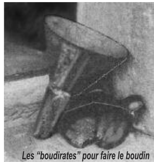
Les "boudirates" pour faire le boudin