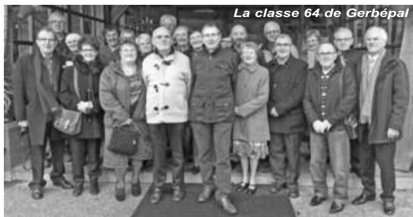
La classe 64 de Gerbépal

Pour les élus de l'opposition qui étaient aux commandes lors du précédent mandat, un autre motif de satisfaction était valorisé : le financement disponible à la fin de 2013 est positif puisqu'il est de 544.000€ : c'est deux fois plus qu'en 2012. Au bilan 2013, la trésorerie affiche un million d'euros. "C'est un très bon chiffre" commentera la Trésorière. Elle précisa que plus de la moitié des foyers fiscaux graingeauds sont non-imposables sur le revenu.