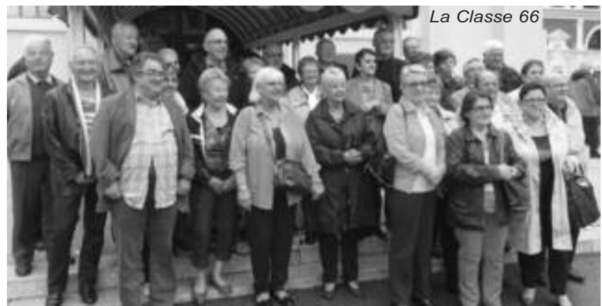
La Classe 66

La Classe 66 projette pour l'an prochain, une sortie à Paris sur deux jours avec visite de la capitale, déjeuner croisière sur la Seine et dîner spectacle au célèbre cabaret parisien « Le Paradis Latin ».