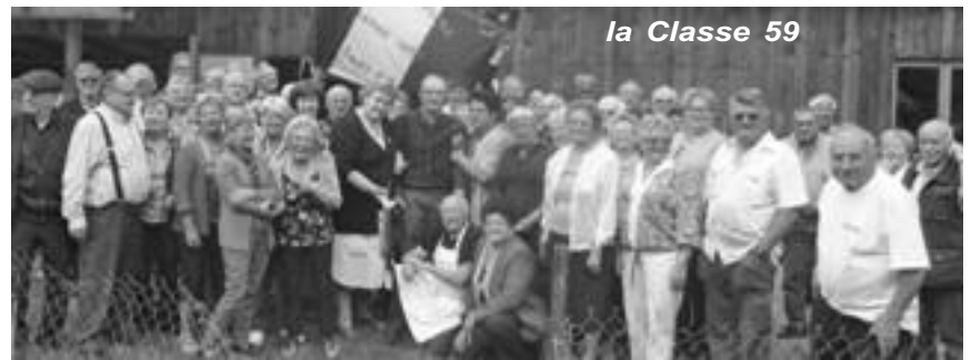
la Classe 59

Une magnifique croisière qui a fait découvrir des villes comme Spitz, Budapest, Bratislava, Esztergom, Vienne, Melk pour ne parler que des plus imposantes, mais aussi des merveilleux paysages, tels que des châteaux, des abbayes, des ruines gothiques qui alternent avec des villages pittoresques. A bord, une grande surprise attendait les amicalistes 59, avec un énorme gâteau aux couleurs de la classe en croisière. Une très belle pâtisserie, préparée par les pâtisseries