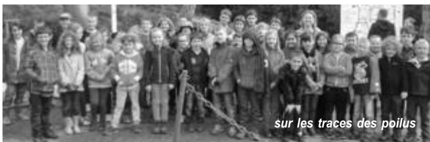
sur les traces des poilus

Les travaux se poursuivront ensuite, routes de la Gaisse, de la Goutte et des Monts. Des informations seront données ultérieurement.