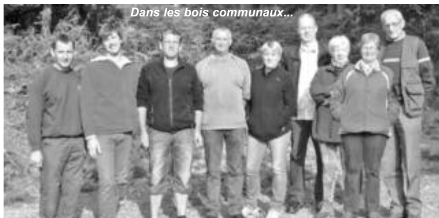
Dans les bois communaux...