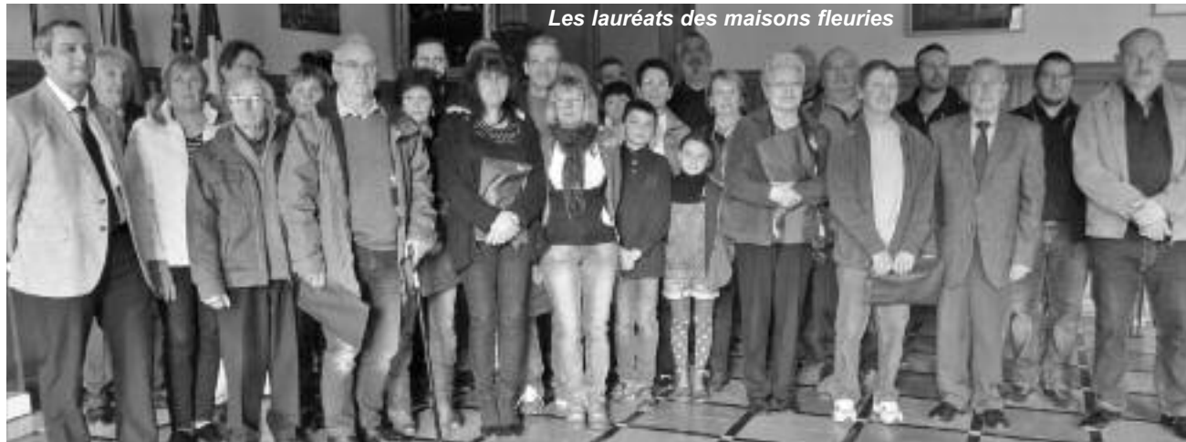
Les lauréats des maisons fleuries

Menu : Kir et ses amuse-bouche ; feuilleté aux grenouilles ; pintadeau sauce suprême, gratin dauphinois, carottes à la crème ; ronde des fromages, salade ; vacherin ; café. Boissons non comprises.