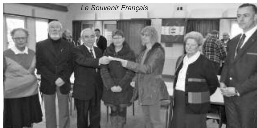
Le Souvenir Français