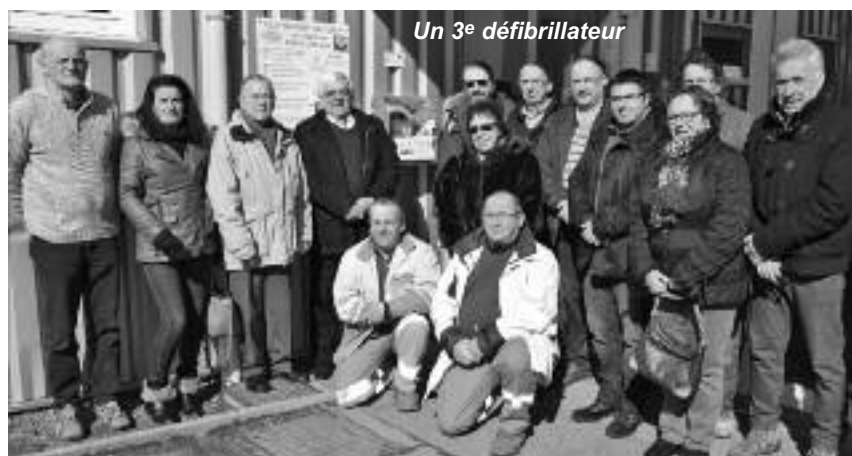
Un 3 e défibrillateur

A la demande de la Communauté de Communes de Saint-Dié-des-Vosges, il sera proposé plusieurs animations dans les locaux du Pôle de l'éco-construction des Vosges à Fraize, rue des Aulnes.