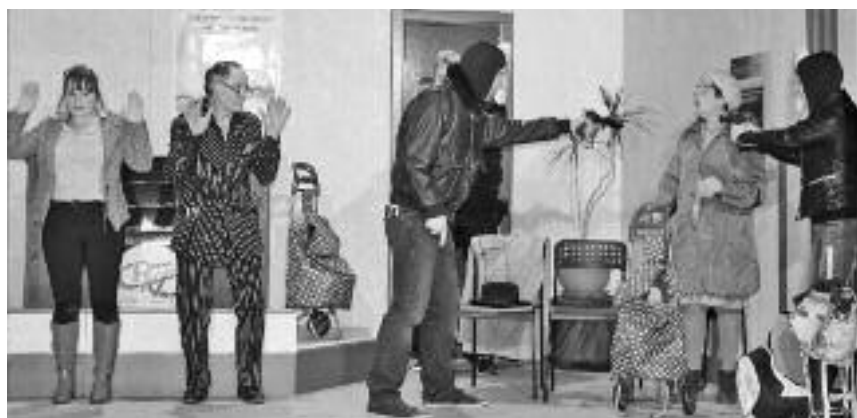
Même menacée par 2 voleurs, Ginette ne semble pas s'en laisser compter

talents merveilleusement encouragés et mis en scène par un certain Jean Delagoutte.