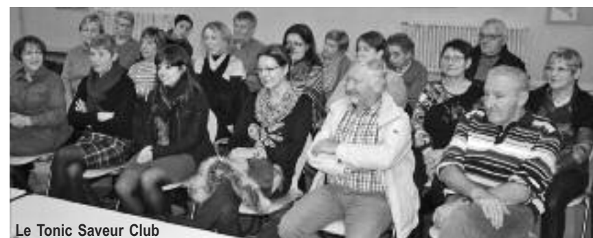
Le Tonic Saveur Club