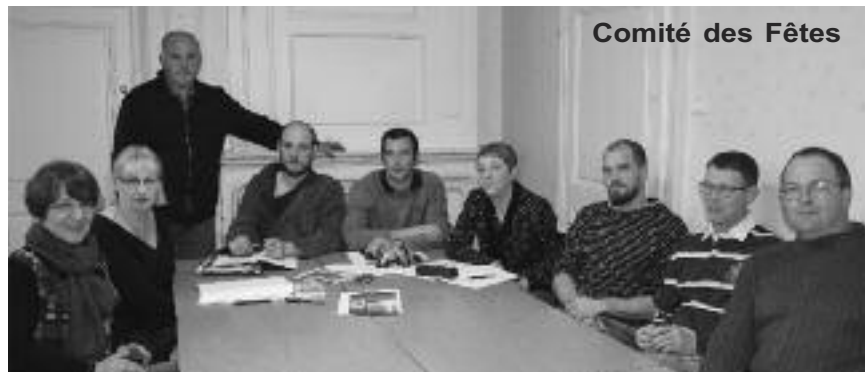
Comité des Fêtes

A l'issue du vin d'honneur sous le préau de l'école, les membres des AFN ont partagé un repas au restaurant La Clef du Ban dans une ambiance amicale.