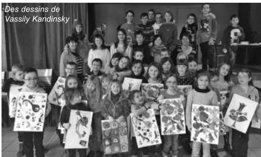
Des dessins de Vassily Kandinsky