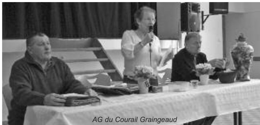
AG du Courail Graingaud

La prochaine collecte de sang organisée par l'Amicale des donneurs de sang du secteur de Granges et ses environs est prévue le samedi 28 mars de 8h30 à 12h à la salle des fêtes locale. Une autre est également prévue le lundi 27 juin de 16h à 19h30 à la salle des fêtes.